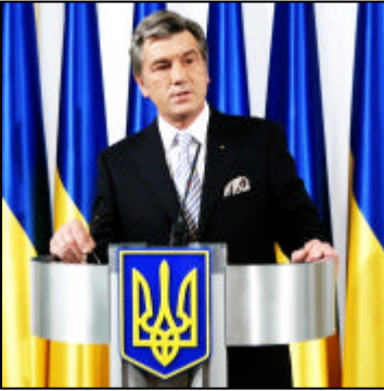
Ukrayna Cumhurbaşkanı Viktor Yuşçenko parlamentoyu feshetti.