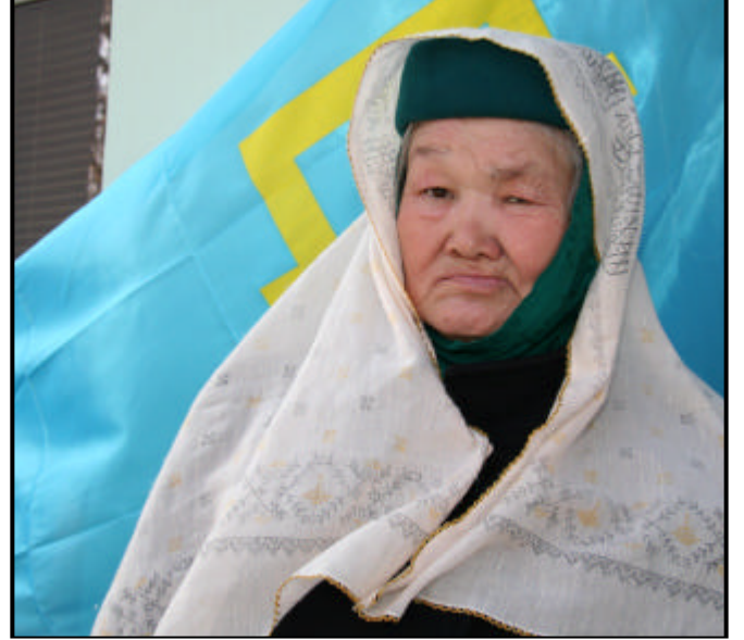
Kırım - Akmescit - 29.9.2008